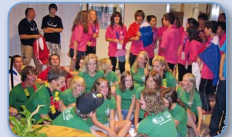
Spaß ist auch 2011 in Tschechien angesagt.

Das nächste internationale Jugendcamp des katholischen Sportverbandes FICEP ist vom 28. Juli - 5. August 2011 in Kroměříž/Tschechien geplant. Sportliche Aktivitäten, selbst gestaltetes und angebotenes Kultur- und Abendprogramm, Impulse und Gottesdienste lassen dieses Treffen von 14 bis 17 jährigen Mädchen und Jungen zu einem unvergesslichen Gemeinschaftserlebnis werden. Das Vortreffen des DJK Sportjugend Teams findet vom 26. – 28. Juli im Bereich Würzburg/Nürnberg statt. Der TN-Beitrag beträgt 300 € zzgl. der Fahrtkosten zum Treffpunkt. Also Werbung machen und junge Leute anmelden. Infos und Anmeldung: DJK Jugendreferat, Postfach 320229, 40417 Düsseldorf, Tel.: 0211-9483618 oder info@djk-sportjugend.de