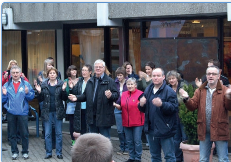
bewegter Morgenimpuls im Innenhof des Jugendgästehauses Oberwesel