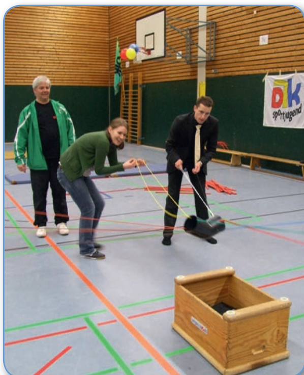
Spaß und Freude, wenn das Zusammenspiel zum Ziel führt

einer Video-Clip-Dance-Gruppe der DJK Rheinwacht Oberwesel, die ihm ihr Engagement im Tanz eindrucksvoll demonstrierten. Der Bischof betonte, dass die DJK für die Kirche die Chance eröffne, Menschen zu erreichen, die scheinbar weit entfernt von Kirche stünden. „Wir müssen für Seiteneinsteiger offen sein und diese integrieren“, da kann die DJK in ihren 85 DJK-Sportvereinen im Bistum Trier einiges leisten, auch wenn man die Ergebnisse nicht so konkret beschreiben kann. „Ich weiß nicht, ob eine Mitgliedschaft in der DJK mich nachhaltiger in das Bischofsamt geführt hätte“. Der abschließende Konferenztag war geprägt durch die Zusammenfassung der Ergebnisse der Open-Space-Phase sowie der Reflektion des Wochenendes. Natürlich kam der Dank an die ausrichtende DJK-Sportjugend Oberwesel und an die DJK-Diözesanjugendleitung Trier nicht zu kurz, denn schließlich wurde mit großem Aufwand und Engagement sowie viel Herz ein besonderer DJK-Bundesjugendtag umgesetzt. Mit der herzlichen Einladung für den DJK-Bundesjugendtag 2012 nach Passau endeten die drei herrlichen Tage in Oberwesel.